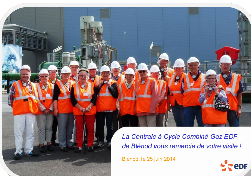
La Centrale à Cycle Combiné Gaz EDF de Blénod vous remercie de votre visite !

Équipés de la tenue ad'hoc, nous nous rendons sur le lieu des installations. L'hôtesse présente les différents éléments de la chaîne de production, le captage et le traitement de l'eau tirée de la