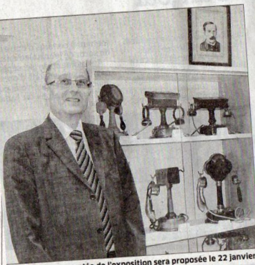
Une visite commentée de l'exposition sera proposée le 22 janvier.