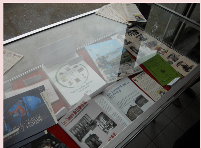
Les vitrines mises à disposition de Lorhistel .