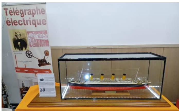
Ph. J. Marques.