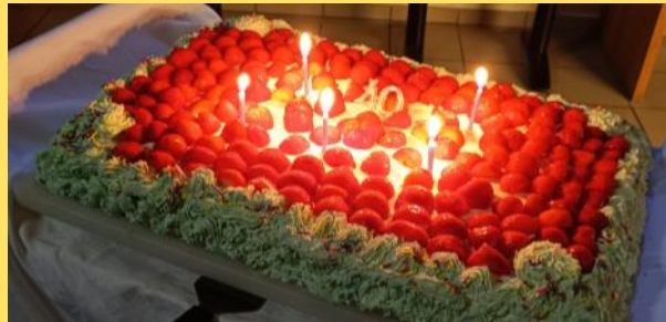
Le gâteau du 40 e anniversaire de la FNARH.