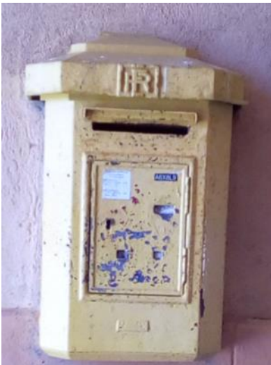
Le courrier pour Sainte-Odile. Elle fut sans doute peinte en bleu à l'origine.