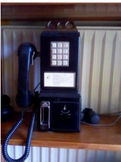
Un téléphone à pièces que je ne connais pas, sans doute étranger. Alsace.