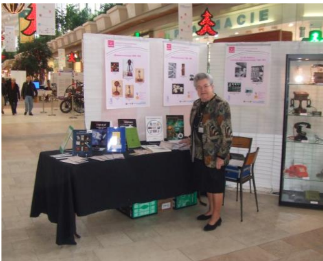
En novembre 2008, durant l'exposition au Mont-Saint-Martin dans les locaux du magasin Auchan.