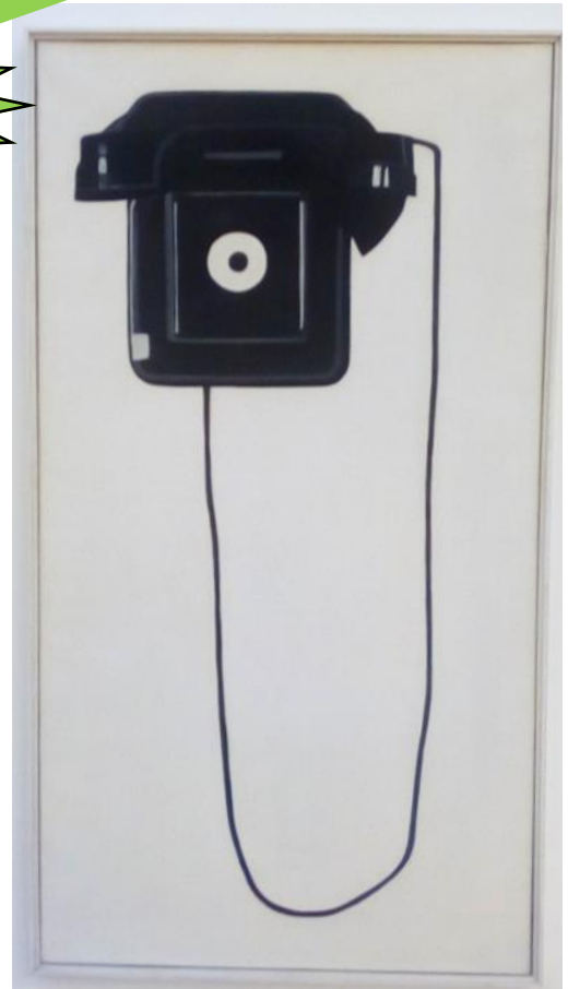
Ceci n'est pas un poste mural mais une peinture au Musée d'Issoudun.

Jean-Louis Mascré, au cours de ses balades, a trouvé quelques sujets de réflexion !