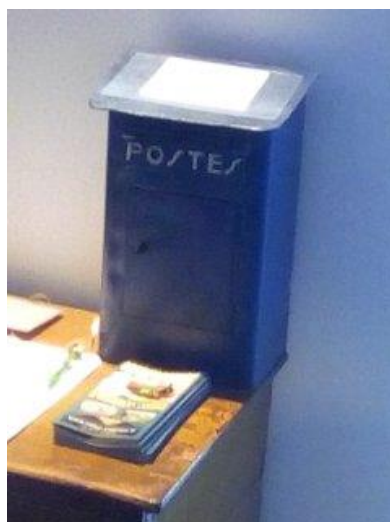
La boîte bleue d'un petit train Velay Express du côté de Roucoules en Haute-Loire.