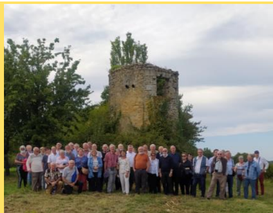
Ph. J. T.