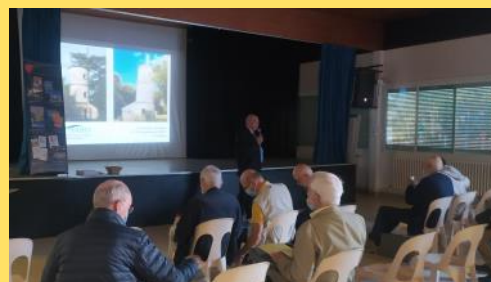
Ouverture des travaux.