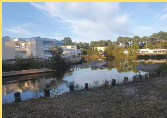
Vue sur le Wake Park.

De belles journées d'étude au cours desquelles nous avons également pu assister à la remise de la médaille de l'UNATRANS à la FNARH (en l'occurrence à son président) par le président de l'Amicale des Anciens de la Poste aux Armées, mandaté pour l'occasion. Vidéo à découvrir dans l'onglet « Membres » puis « Partenaires » du site Internet de la FNARH : https://www.fnarh.com .