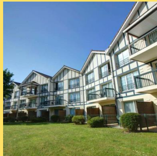
Najeti Hôtel du Parc.