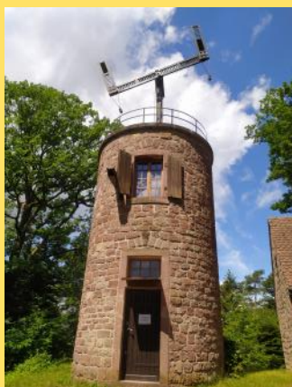
Tour du Haut-Barr.